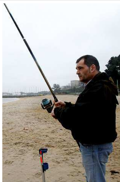
Orol reclama una mayor unión de los pescadores.

-Entiendo que la Administración lo que pretendía, según dicen los que asistieron al comité de pesca, es que se dañe menos a los peces en aguas salmoneras, no que se pesque menos. Yo, como pescador de mar, pongo siempre anzuelos simples en señuelos como los pooper que utilizo para la robaliza, porque pierdo menos picadas. En el río, si entran peces pequeños con